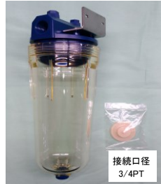
プレフィルター-Lアングル付