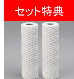
フィルター2本サービス